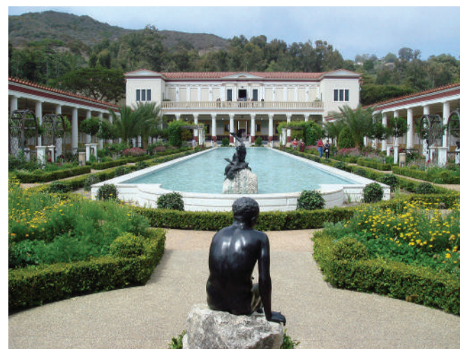
Jardin de la villa Getty

Dans le cadre de l'exposition Sète-Los Angeles au JAM du 16 mars au 19 mai 2019.