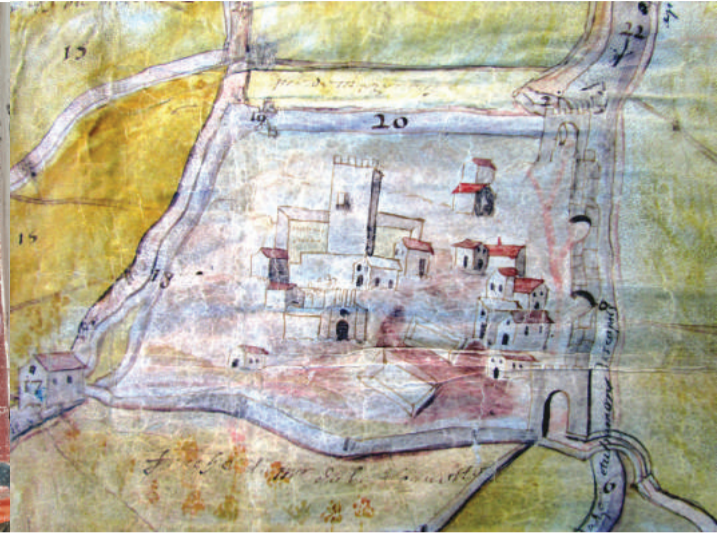
Photos : 1) Mas de Roux Castries - 2) Capestang - ©Georges Puchal - RCCPM - 3) Lattes