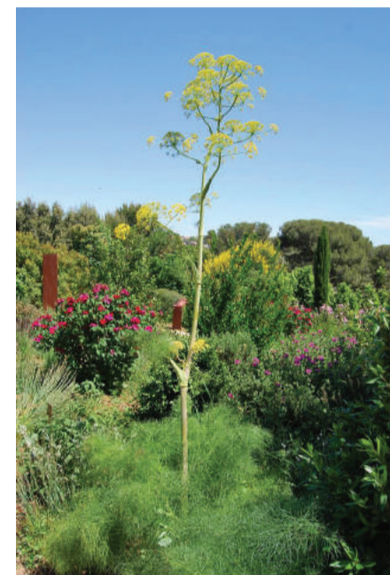
Grande ferule

Organisée dans le cadre de la Fête de la Nature du 22 au 26 mai A l'honneur en 2019 : la nature en mouvement!