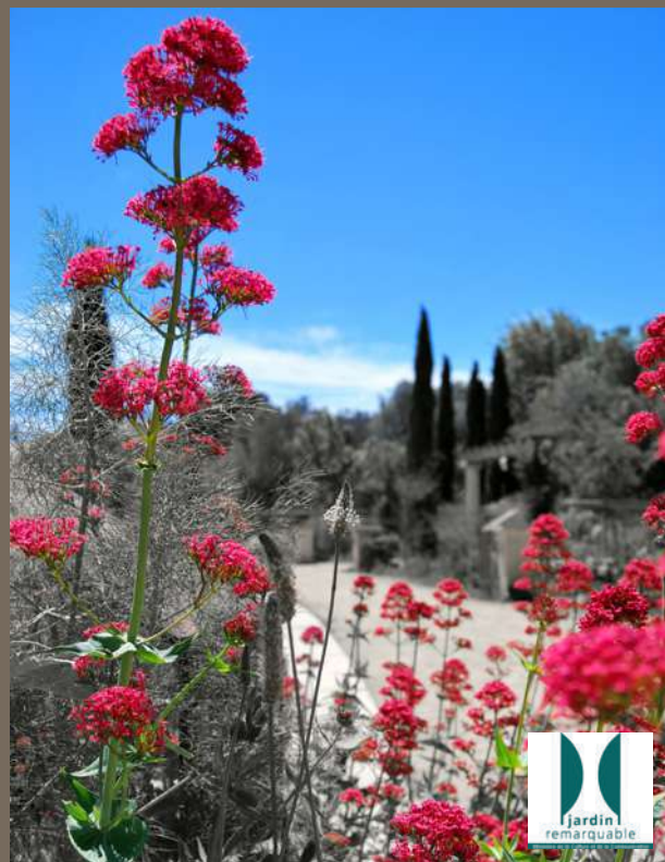
Art & nature