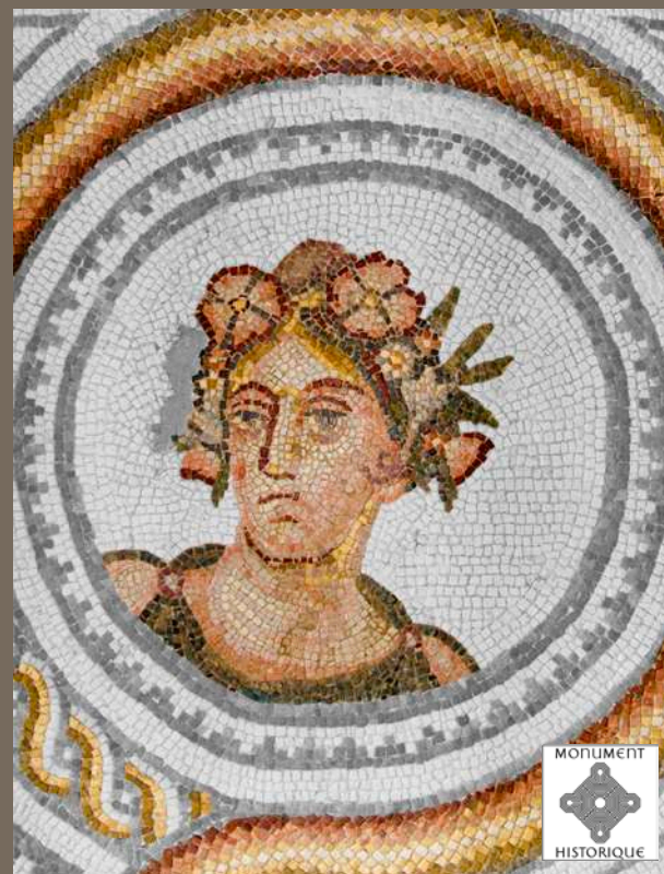
Villa & mosaïques