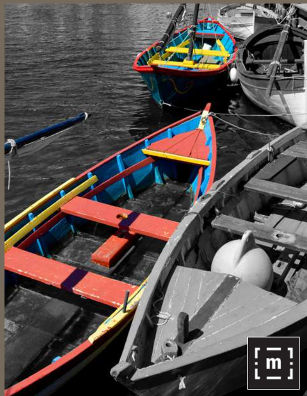
Lagune & métiers