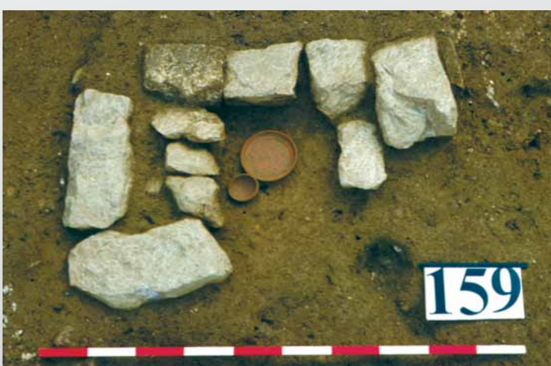
Vue de l'un des dépôts d'offrandes