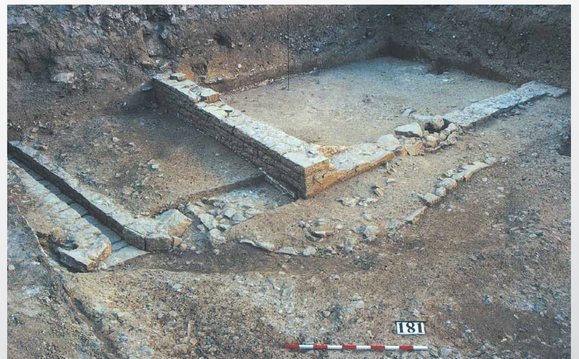
Vue du bâtiment cultuel