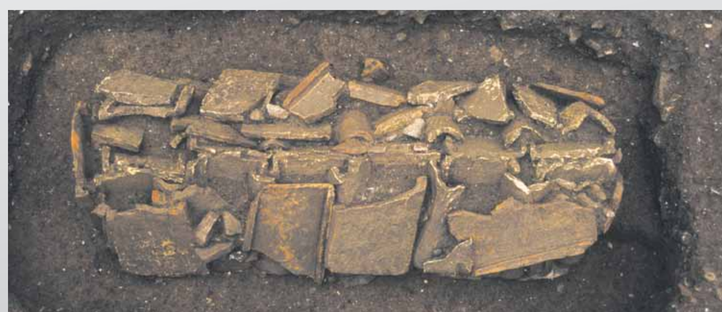
Vue de la couverture d'une tombe de l'Antiquité tardive aménagée à l'aide de tuiles disposées en bâtière