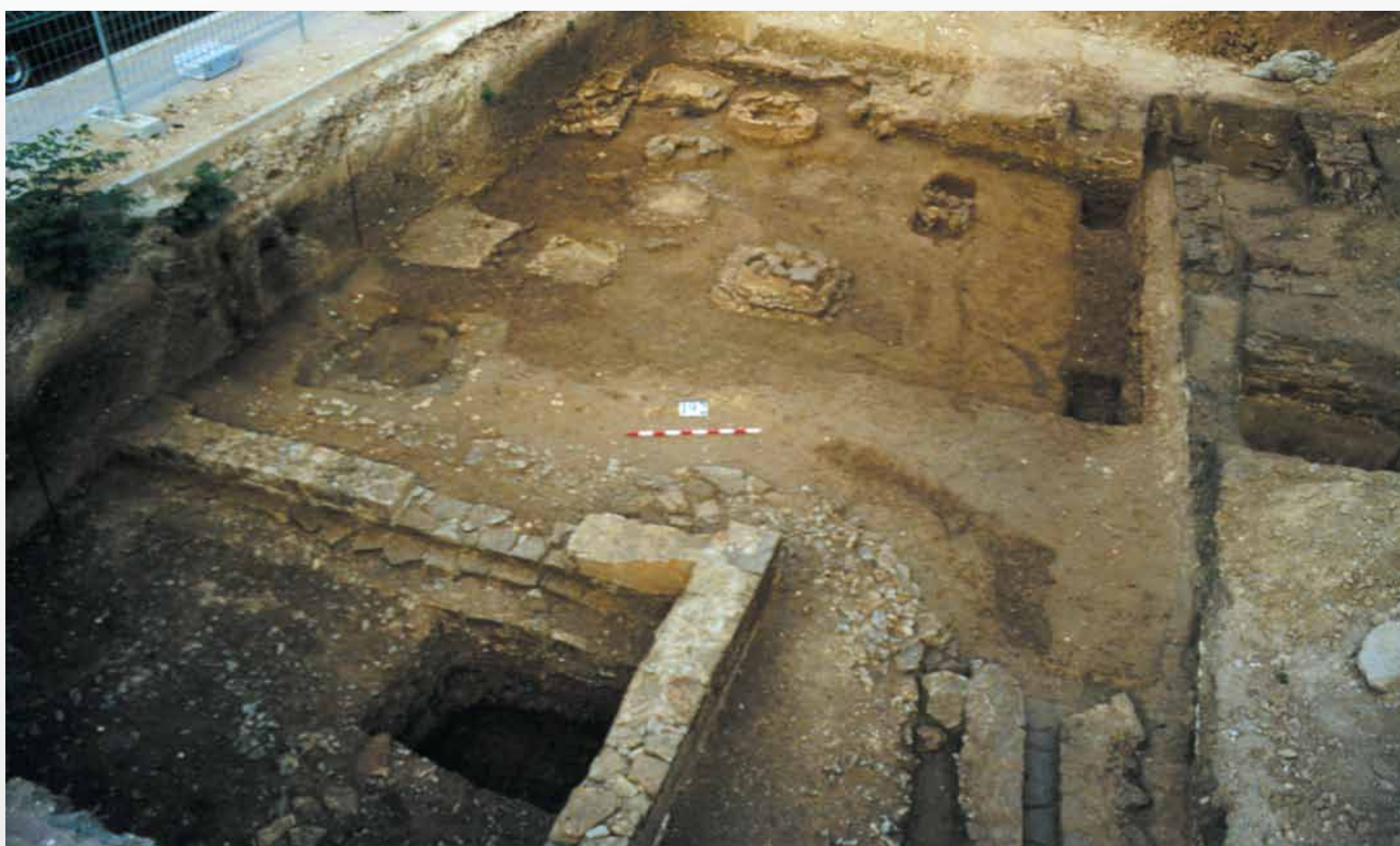
Vue générale de la fouille, avec au premier plan le bâtiment cultuel