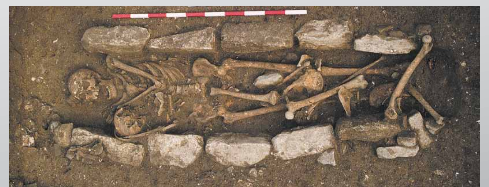
Vue des défunts après retrait de la couverture

À l'occasion du renouvellement d'une canalisation dans la rue de la République, le service d'archéologie préventive de Sète agglomération méditerranée intervient actuellement pour étudier tous les vestiges qui pourraient être mis au jour lors de ces travaux. Ces nouvelles observations permettront peut-être de compléter le plan du sanctuaire partiellement fouillé en 1995 et de mieux comprendre son intégration dans le tissu urbain antique.